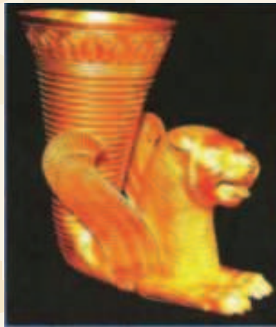
ריטון פרסי - גביע היין המפחיד

כפי שהובא לעיל, אף אחשורוש בכבודו ובעצמו אינו יכול להפר את החוק שחוקק בעצמו. הברירה היחידה היא, לחוקק 'חוק עוקף המן'. המן במזימתו השטנית תכנן שהיהודים במדינות הרחוקות לא יידעו כלל שביום מסוים ייצאו גודדי אנטישמיים מזוינים, בגיבוי צבאות האימפריה הפרסית, ויהרגו בהם. מפני כך הוא תכנן שבאגרת הגלויה, 'פתשגן הכתבי' הגלוי לכל העמים, יהיה כתוב רק להיות עתידים ומוכנים ביום הזה עם כלי נשק, ביום י"ג באדר, אך לא נאמר נגד מי יש להלחם. זאת נאמר רק באגרות ששלחו לצמרת הממשל - האחשדרפנים, הפחות והשרים (ג), ריטון פרסי - גביע היין המפחיד