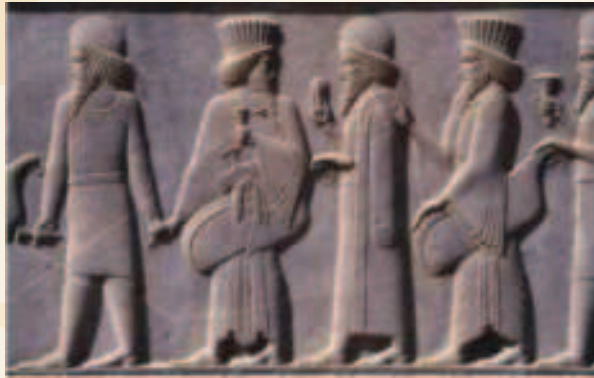
"חיל פרס ומדי" קטע תבליט של שומרי הראש. חייל פרסי - כובע רבוע ועוטה שמלה, חייל מדי- כובע מעוגל ולבוש קצר

היהודים גם אינם נאמנים לחוקי המלך - "ואת דתי המלך אינם עושים". לא פרש הכתוב אלו דוגמות הציג המון לפני אחשורוש, אך כבר בארו חז"ל שהייתה התנגשות בין צורכי הממלכה לבין חגי היהודים 33 , שאומרים שהם מנועים מעבודת המלכות מפני ש"שבת היום פסח היום" (עיי' מגילה יג. ועיי' אסת"ר ו'). מעניין לציין שאנטישמים שונים במהלך הדורות ציינו טענה זו שהעם היהודי הוא 'עם בטלן', פעם בשבעה ימים