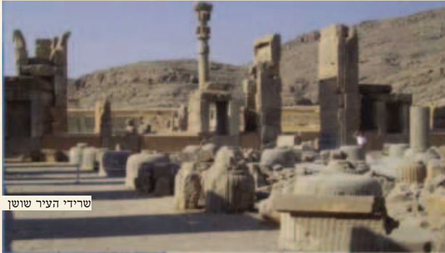
שרידי העיר שושן