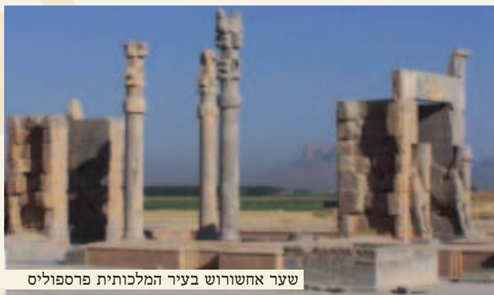
שער אחשורוש בעיר המלכותית פרספוליס

את המתחזה, ולהמליך תחתיו את אחד מבני המשפחות הללו. בראש הקושרים עמד דריווש הראשון (אבי אחשורוש 35 ), לאחר מכן הועלה דריווש למלכות. לתוכנית הקשר להפלת גומתא המתחזה, הם החליטו להוסיף תנאי, לאחר שייבחר המלך מביניהם, "לכל אחד